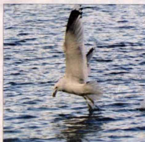
HAVMÅGERNE har fået let ved at finde føde.

»De sidste par år har vi fået fint besøg her i Øresund, både hvaler, delfiner, sværdfisk og klumpfisk har lagt vejen forbi,« siger han. ▲