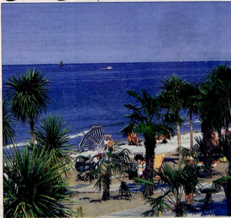
DER ER TRÆNGSEL på de 100 meter Tropical Beach i Helsingborg, både om dagen og om natten.

ten, er der masser af gode steder i Skåne. Kysten myldrer med små og skønne badebassin. Lige fra de store etablerede strande med bassiner og minigolfbaner i Tobisvik, nord for Simrishamn til de mere enkle og anonyme strande, hvor man kan bade uforstyrret i den sydlige og østlige del af Skåne. ▲