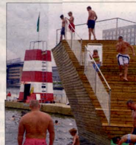
OP TIL tusind mennesker bruger havnebadet på Islands Brygge i København, når solen står højt.

Faktisk er det blevet så stor en succes med