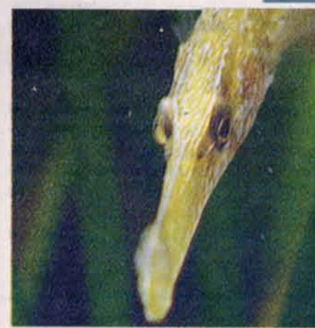
... ligesom tångsnällan.