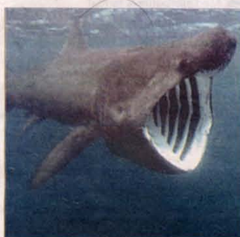
VERDENS næststørste haj besøger Øresund for at finde mad. Den kan blive op til 12 meter lang.