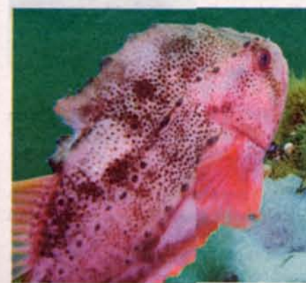
Stenbidere trives i sundet.